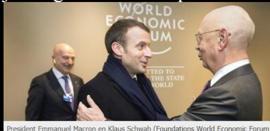
President Emmanuel Macron en Klaus Schwab (Foundations World Economic Forum)

De kroon op hun gehoorzaamheidstraining heeft de Tweede Kamer en de regering glansrijk doorstaan. Gefeliciteerd Klaus Schwab, je kan trots zijn op jullie globalistische plannen. Ze kunnen doorgang vinden voor de totale controle.